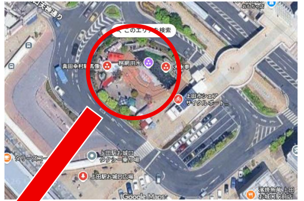
【会場：上田駅水車前広場】