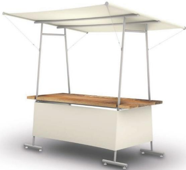
【マルシェスタンド】