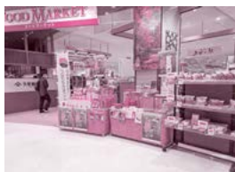
イトヨーカドーアリオ上田店会場

上田商工会議所では、中部横断自動車道の全線開通のメリットなどを広く周知し、早期開通につなげるため、同自動車道の沿線の経済団体による「中部横断自動車道経済懇談会」に参画しています。中部横断道全線開通に向けた取り組みの一環として、