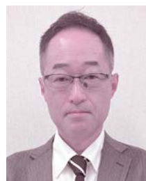
株式会社JTB 長野支店 副支店長