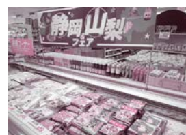
やおふく古里店会場

開催期間は、イトヨーカドーアリオ上田店において9月27日(水)～10月12日(木)、やおふく古里店において10月13日(金)～10月26日(木)まで開催されました。静岡県ではうなぎパイ、安倍川もち、山梨県では土産菓子やほうとうなど地域ならではの商品に人気が集まっていました。