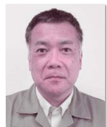
日軽松尾株式会社 代表取締役