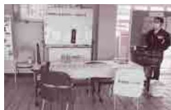
参考：大学構内企業PR実施例

学生に地域の企業を知ってもらう企画として大学構内での企業PRを実施しています。学生に対する地元企業の認知度向上のため是非ご活用ください。