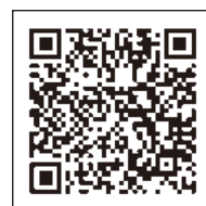
消費者向け説明会 申込フォーム

■お申込み 専用申込フォーム(右記QRコード)または、当所ホームページ( http://www.ucci.or.jp/info/news/paypay30back/ )からお願いします。