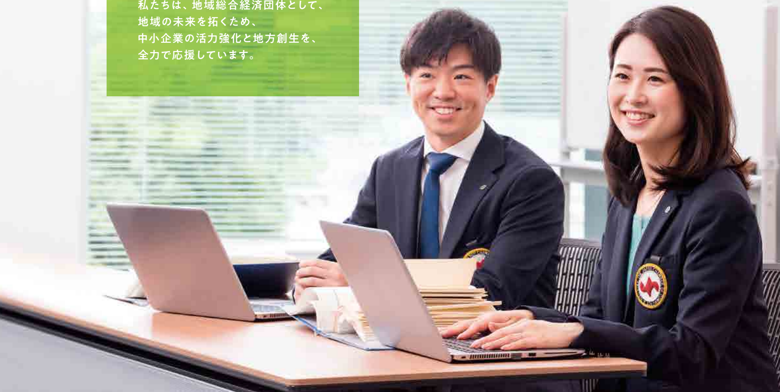
撮影場所：東京商工会議所ビル

私たちは、地域総合経済団体として、 地域の未来を拓くため、 中小企業の活力強化と地方創生を、 全力で応援しています。