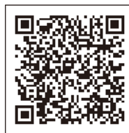
当所ホームページ

現在新型コロナウイルス感染症の影響から、接触機会の多い現金支払いではなく、キャッシュレス決済の導入が推奨されています。上田市の中規模・小規模の対象加盟店の売り上げ向上と、キャッシュレス決済利用のさらなる促進を目的とした本キャンペーンをぜひご利用ください。キャンペーンの詳細は、当所ホームページ(右記QRコード)をご覧ください。