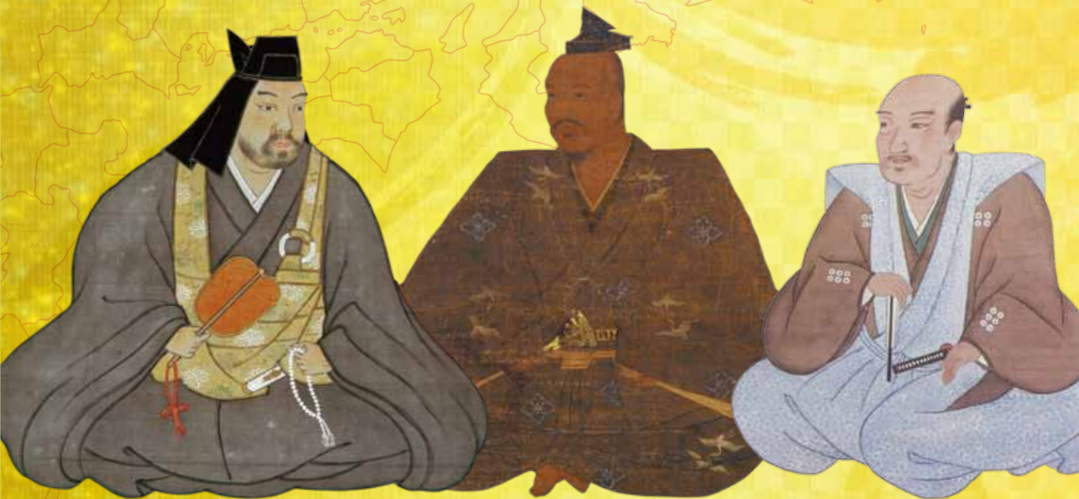
上杉謙信公:上杉神社所蔵

戦国武将ゆかりの地で「学ぶ!」「食べる!」「必勝祈願!」 強い武将にあやかる「必勝祈願の旅」をもっと楽しむように、こだわりのおすすめを紹介!します!