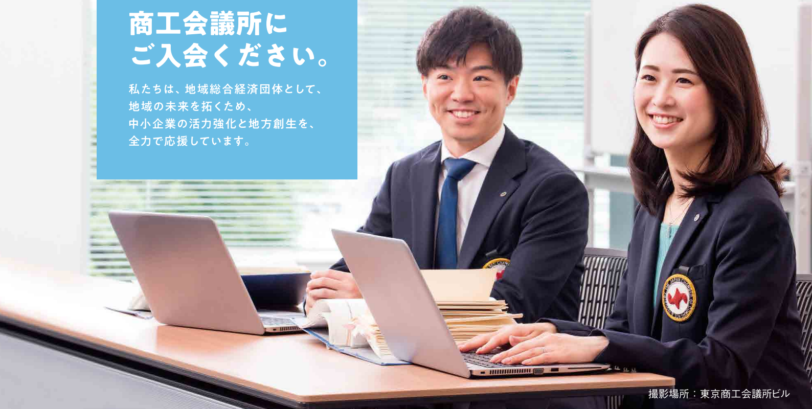
撮影場所：東京商工会議所ビル

私たちは、地域総合経済団体として、地域の未来を拓くため、中小企業の活力強化と地方創生を、全力で応援しています。